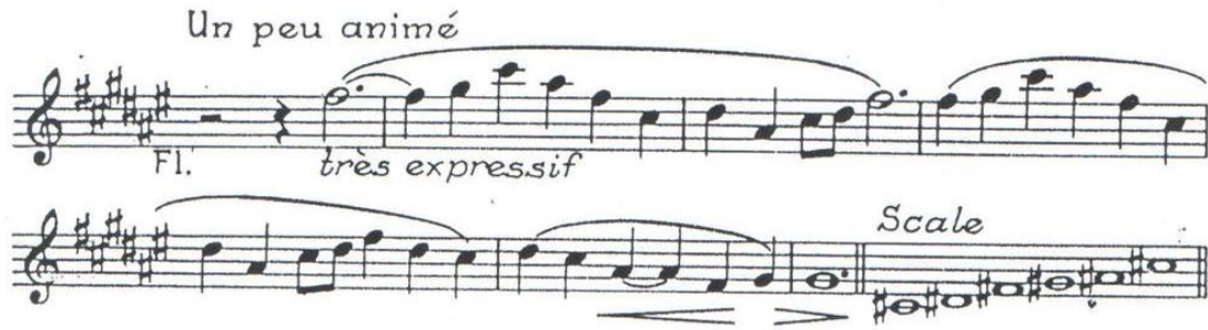
شكل رقم (1)