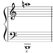
شكل رقم (١٠)

- المسافات اللحنية : استخدمت مسافات لحنية متسعة جدا صعودا وهبوطا خاصة في م (٢٨) مع استخدام قفزات بالأوكتاف والسابعة اللحنية والخامسات والرباعيات الزائدة والناقصة . - الحركة اللحنية مفردة أم مزدوجة : ظهرت الحركة اللحنية بشكل يجمع بين النغمات المفردة والمزدوجة من نغمتين أو من خلال التآلفات الهارمونية من ثلاث نغمات . - المساحة الصوتية : تم استخدام مساحة صوتية في نطاق واسع جدا بالشكل التالي .