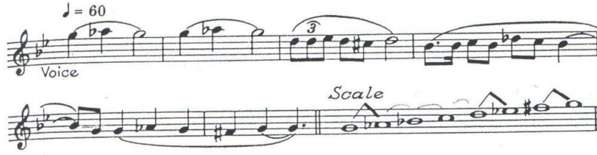
شكل رقم (٤)

Ex. 47 BRITTEN: Serenade—Dirge (1943) p18