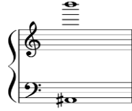
شكل رقم (٩)